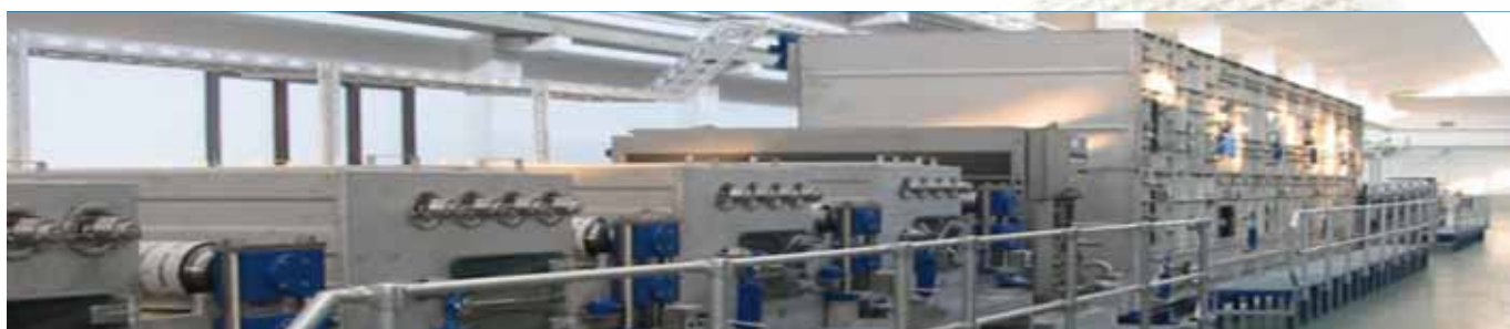
Fig. 8, 9 y 10