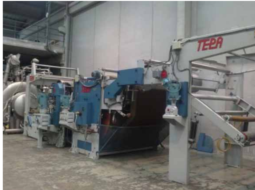
Sanfor salida carro bota y pliegue libro fig.6

El proceso de sanforizado hace que la tela encoja de manera controlada. Se efectúa pasando la tela frente a un atomizador de agua, posteriormente, la tela es introducida entre una banda de caucho y un tambor caliente, los cuales comprimen los hilos de pie. Mediante el sanforizado se puede reducir al máximo la contracción de la prenda acabada. El algodón, igual que todas las fibras naturales (lana, seda, lino), encogen si se lavan con agua caliente o se utiliza la secadora, y no encogen si se lavan con agua fría y se deja secar al aire.