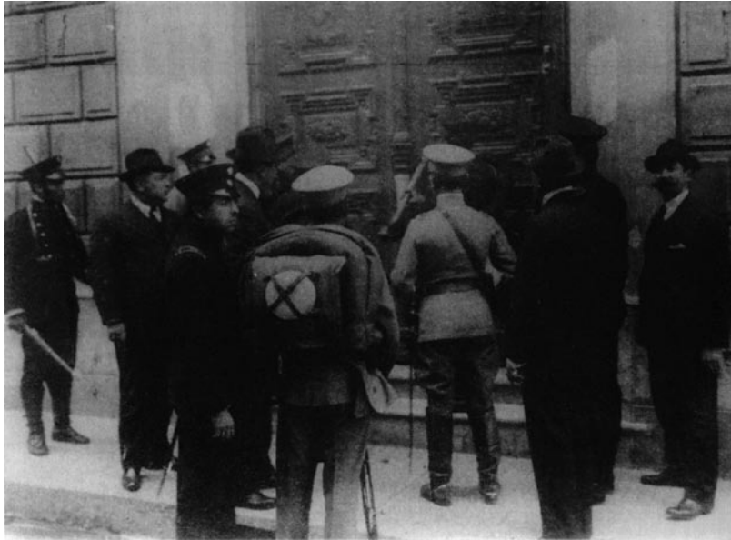
Soldados, bomberos y policías en la UNC, septiembre, 1918 (AGN).