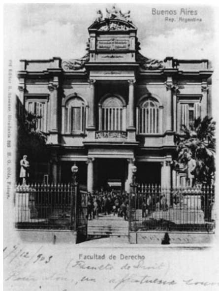
Facultad de Derecho y Ciencias Sociales. (Calle Moreno) Postal de la época.