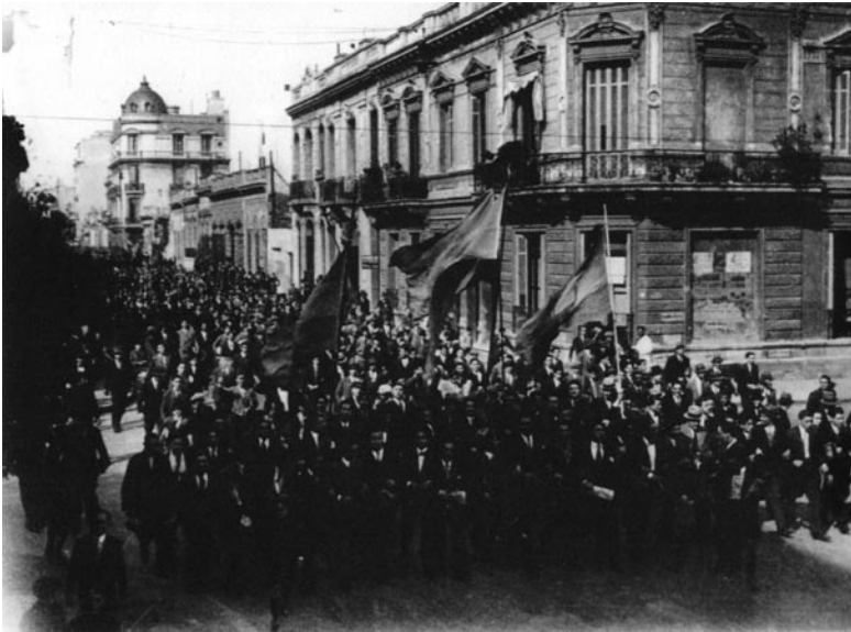
Manifestación estudiantil, septiembre de 1930 (AGN).