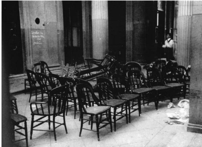
“Mesas y sillas... las únicas víctimas”. Protesta estudiantil en Derecho. Caras y Caretas, 1919.