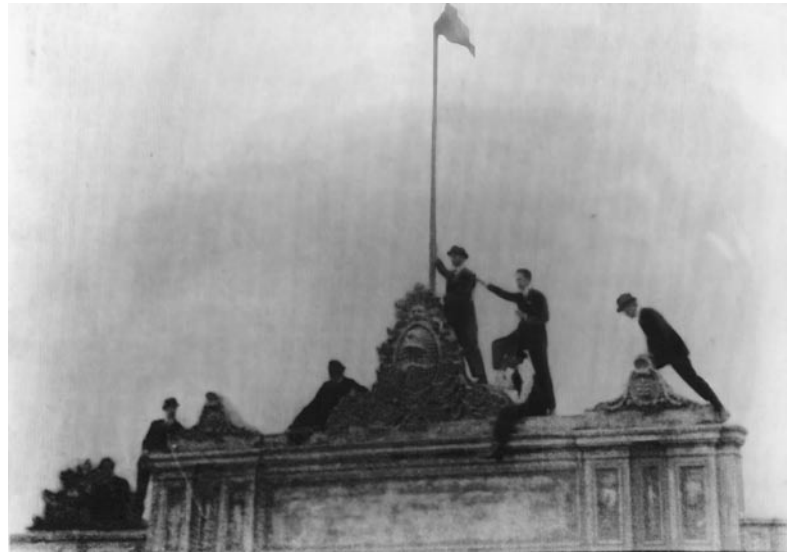
Ocupación por parte de los estudiantes de la Universidad de Córdoba, 1918 (AGN).