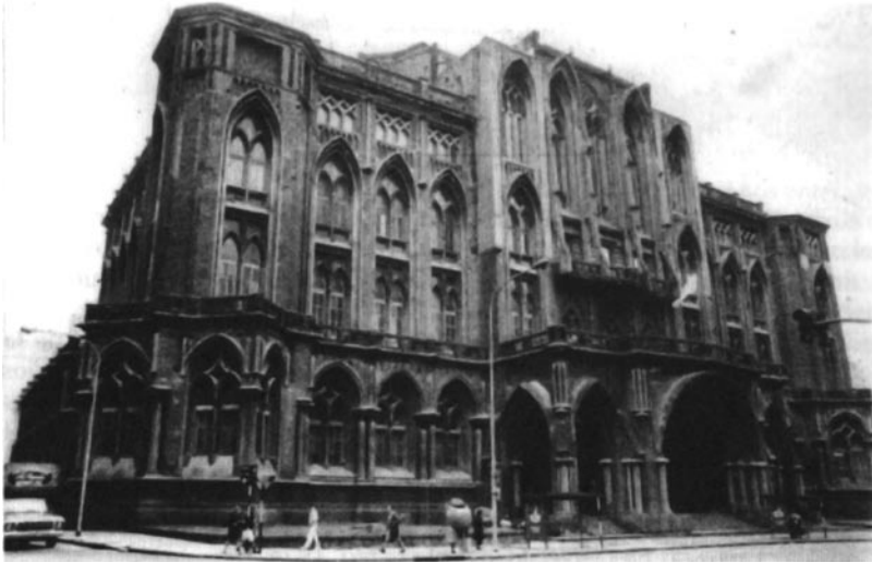
Facultad de Derecho y Ciencias Sociales. (Calle Las Heras) (AGN).