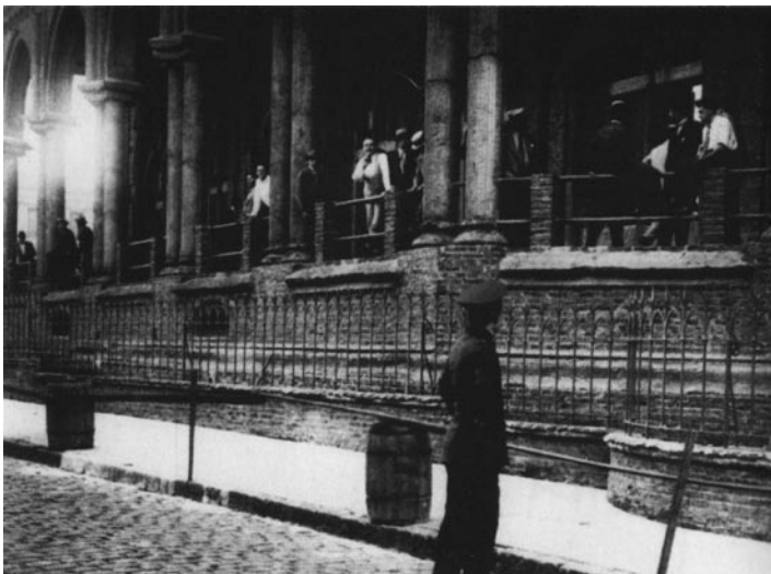
Toma de la Facultad de Derecho, 1929.