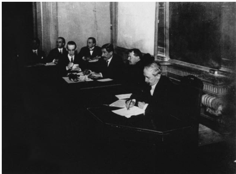
Elecciones en la Universidad de Buenos Aires. Década de 1920 (AGN).