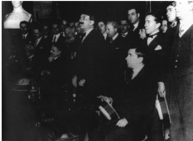
El doctor Alfredo Palacios, Conferencia en 1923 (AGN).